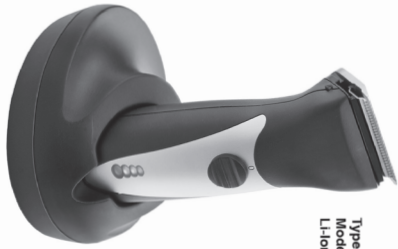
Type 1871 Li+ Model 1871 Li+ Li-Ion

en Operating Instructions Cord/Cordless Hair Clipper es Instrucciones de uso Máquina de corte de pelo con alimentación de red/por batería